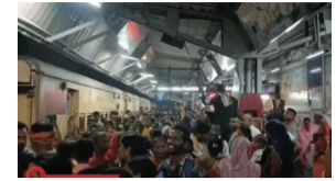
लोकतंत्र की शान , पटना

बिहार में सिपाही भर्ती परीक्षा का आज दूसरा और अंतिम चरण है। परीक्षा केंद्रों पर अभ्यर्थियों की एंट्री के बाद गेट बंद कर दिए गए हैं। पहली पाली सुबह 10 बजे से 12 बजे तक चली। दूसरी पाली दोपहर 3 बजे से शाम 5 बजे तक चलेगी। राज्य के 38 जिलों में बनाए गए 500 सेंटर्स पर करीब 5.52 लाख अभ्यर्थी परीक्षा में शामिल हुए हैं।