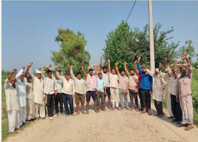
अन्य छोटे वाहन दुर्घटनाओं का शिकार हो रहे हैं। ग्रामीणों के अनुसार गांव राजानागल के निकट सड़क हादसे में एक व्यक्ति की जान भी जा चुकी है।

हसनपुर अमरोहा - भदौरा मार्ग की बदहाल स्थिति को लेकर तहसील हसनपुर क्षेत्र के ग्रामीणों और किसानों में नाराजगी बढ़ती जा रही है। लंबे समय से शक्तिग्रस्त पड़ी सड़क के निर्माण की मांग को लेकर ग्रामीणों ने प्रदर्शन कर प्रशासन का ध्यान आकर्षित किया और जल्द समाधान न होने पर आंदोलन की चेतावनी दी। ग्रामीणों का कहना है कि करीब चार वर्षों से यह मार्ग गहरे गड्ढों और उखड़ी सड़क के कारण आवागमन के लिए परेशानी का सामना करना पड़ रहा है। इस मार्ग से चीनी मिल तक गन्ना पहुंचाने वाले किसानों को सबसे अधिक दिक्कतों का सामना करना पड़ रहा है। खराब सड़क के कारण वाहनों में आए दिन खराबी होते रहती है, जिससे किसानों पर अतिरिक्त आर्थिक बोझ पड़ रहा है। कई वाहन चालकों को मजबूरी में लंबे रास्तों का सहारा लेना पड़ता है। क्षेत्रवासियों ने बताया कि सड़क की खराब हालत का असर स्कूली बच्चों और यात्रियों पर भी पड़ रहा है। स्कूल वाहन समय से नहीं पहुंच पाते हैं, जबकि ई-रिक्शा और