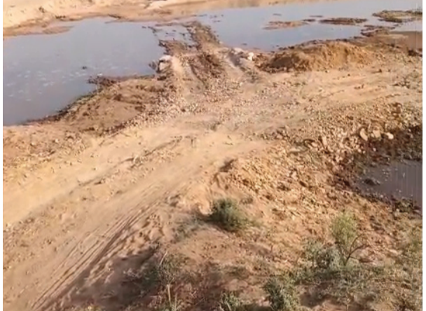
ऊंचा पाण्डेय ब्यूरो प्रमुखा) लोकतंत्र की शान

सौधी। जिला मुख्यालय के समीपी ग्राम सोन नदी के डेम्हा घाट से सामने आई तस्वीरों ने एक बार फिर सोन घड़ियाल अभयारण्य क्षेत्र में जारी अवैध रेत उत्खनन की गंभीरता को उजागर कर दिया है। स्थानीय ग्रामीणों का आरोप है कि अभयारण्य क्षेत्र के भीतर बड़े पैमाने पर रेत का अवैध उत्खनन और परिवहन किया जा रहा है, लेकिन जिम्मेदार विभाग कार्रवाई करने के बजाय मूकदर्शक बना हुआ है। ग्रामीणों का कहना है कि डेम्हा गांव के एक वनरक्षक पर रेत माफियाओं को संरक्षण देने के आरोप लगा रहे हैं। बताया जा रहा है कि उनकी निजी गाड़ी विभागीय कार्यों में भी लगी रहती है और क्षेत्र में जब भी किसी जांच टीम या अधिकारियों के आने-जाने की सूचना मिलती है, तो इसकी जानकारी रिक्लर रेत कारोबारियों तक पहुंचा दी जाती है। इससे माफिया