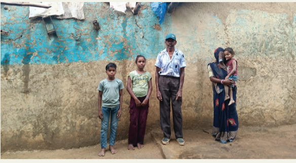
(ऊंचा पाण्डेय ब्यूरो प्रमुखा)लोकतंत्र की शान

सौधी। आजादी के साथ सात दशक बाद भी जब ग्रामीण मूलभूत सुविधा से वंचित रहते हैं तब तमाम विकास के दावे एवं योजनाएं जिनमें समाज के अंतिम छोर में जीवन यापन करने वाले परिवारों के जीवन में परिवर्तन एवं विकास देखे की परिकल्पना है ऐसे दावे खोखले साबित हो रहे हैं जिसका ताजा उदाहरण जनपद पंचायत मड़ौली अंतर्गत ग्राम पंचायत नौढ़िया एवं परसिली के मध्य स्थित कुकरैला टोला का है जहां की 99 प्रतिशत आबादी सिर्फ आदिवासी परिवारों की है जिन्हें सड़क, बिजली, पानी, शिक्षा एवं आवास जैसी मूलभूत सुविधा नहीं मिल रही है। व उन्हें तमाम योजनाएं जो सिर्फ उनके लिए सरकार द्वारा बनाई गई हैं उन तमाम योजनाओं से वंचित है। इनका कहना है। निश्चित ही अभी तक उक्त मोहल्ला में मूलभूत सुविधा की कमी है लेकिन प्रधानमंत्री