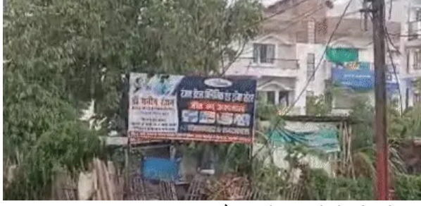
लोकतंत्र की शान , पटना

20 जिलों में अलर्ट, अगले 72 घंटे में पूरे राज्य में पहुंचेगा मानसून, 10 जिलों में हेवी रेन की चेतावनी