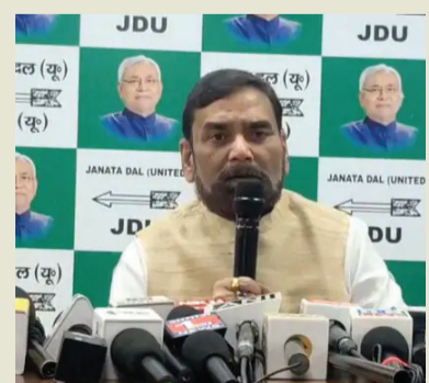
लोकतंत्र की शान, पटना