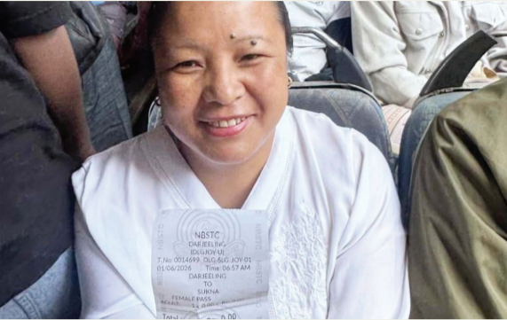
फोटोयुक्त पेंशन दस्तावेज, राज्य अथवा केंद्र सरकार का कर्मचारी पहचान पत्र, स्कूल, कॉलेज या विश्वविद्यालय का पहचान पत्र सहित सरकार द्वारा जारी अन्य वैध पहचान पत्रों में से किसी एक को दिखाकर मुफ्त टिकट प्राप्त किया जा सकता है।

पश्चिम बंगाल सरकार ने सोमवार से राज्यभर में महिलाओं के लिए सरकारी बसों में मुफ्त यात्रा सुविधा लागू कर दी। सरकार की घोषणा के अनुसार अब महिला यात्रियों को सरकारी बसों में सफर के लिए कोई किराया नहीं देना होगा। बस में चढ़ने पर उन्हें “शून्य किराया” का टिकट जारी किया जा रहा है। यह सुविधा राज्य के सभी क्षेत्रों में उपलब्ध है और सामान्य मार्गों के साथ-साथ लंबी दूरी की बसों में भी लागू की गई है। योजना का लाभ लेने के लिए महिला यात्रियों को पहचान संबंधी दस्तावेज दिखाने होंगे। परिवहन विभाग की ओर से जारी निर्देशों के अनुसार आधार कार्ड, मतदाता पहचान पत्र, मनेरशा जॉब कार्ड, आयुष्मान भारत कार्ड, ड्राइविंग लाइसेंस, पैन कार्ड, पासपोर्ट, फोटोयुक्त पेंशन दस्तावेज, राज्य अथवा केंद्र सरकार का कर्मचारी पहचान पत्र, स्कूल, कॉलेज या विश्वविद्यालय का पहचान पत्र सहित सरकार द्वारा जारी अन्य वैध पहचान पत्रों में से किसी एक को दिखाकर मुफ्त टिकट प्राप्त किया जा सकता है। सोमवार सुबह से राज्य परिवहन निगम और अन्य सरकारी