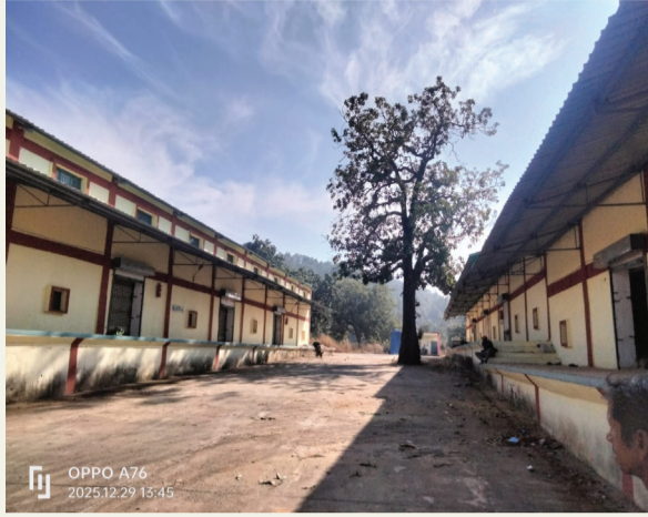
टीम का गठन कर नए सिरे से इस भ्रष्टाचार में शामिल सभी जिम्मेदार अधिकारियों एवं कर्मचारियों की करतूतों का खुलासा होगा। लेकिन यह जांच फाइलों में ही कैद होकर रह गई। उल्लेखनीय है कि जिले के