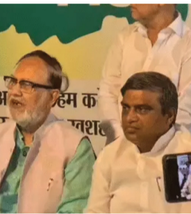
लोकतंत्र की शान, पटना