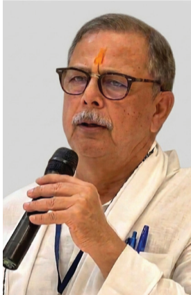
जा रही है। उन्होंने कहा कि भले ही कम्पनी की पहुंच ऊपर तक हो लेकिन इस कृत्य को किसी भी कीमत पर बर्दाश्त नहीं किया जाएगा। सिंह ने बताया कि उन्होंने मुख्यमंत्री मोहन यादव से भी इस संबंध में बात की है और कहा है कि जब तक किसानों की सहमति

सीधी। पूर्व नेता प्रतिपक्ष अजय सिंह ने जिले के चुरहट क्षेत्र में पावर ट्रांसमिशन परियोजना के लिए किसानों की सहमति के बिना उनके खेतों में जबरन टावर बनाये जाने को पूरी तरह गैर-कानूनी, दमनकारी और किसानों के अधिकारों पर सीधा हमला बताया है। अजय सिंह ने कहा कि अडानी की कम्पनी के लोग खेतों में जबरन चुसकर किसानों की खड़ी फसलों को नबाद कर रहे हैं। ऊपरी पहुंच बताकर उनके द्वारा अभद्र व्यवहार किया जा रहा है। विरोध करने पर किसानों को झूठे मुकदमों में फंसाने की धमकियां दी