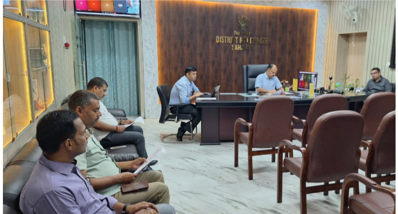
लोकतंत्र की शान

सहरसा, मो. जियाउद्दीन, जिला संवाददाता: सहरसा जिला प्रशासन द्वारा जन समस्याओं के त्वरित एवं प्रभावी समाधान के उद्देश्य से पंचायत स्तर पर 'सहयोग शिविर' के आयोजन को लेकर संयुक्त आदेश जारी किया गया है। यह शिविर प्रत्येक माह के प्रथम एवं तृतीय मंगलवार को आयोजित किए जाने की व्यवस्था के तहत 2 जून 2026 को जिले की विभिन्न पंचायतों में आयोजित किया जाएगा। जारी आदेश के अनुसार, शिविर का आयोजन पंचायत सरकार भवन अथवा उसके समीप किसी सार्वजनिक स्थल पर किया जाएगा, जहां आम नागरिक अपनी समस्याएं सीधे अधिकारियों के समक्ष रख सकेंगे। इस दौरान जिला स्तरीय एवं प्रखंड स्तरीय पदाधिकारी उपस्थित रहकर शिकायतों का मौखिक समाधान सुनिश्चित करेंगे। प्रशासन ने स्पष्ट निर्देश दिया है कि सभी संबंधित दंडाधिकारी, पुलिस पदाधिकारी एवं पुलिस बल अपने-अपने निर्धारित स्थानों पर सुबह 9 बजे तक पहुंचकर विधि-व्यवस्था बनाए रखें। प्रत्येक शिविर स्थल पर सुरक्षा के मद्देनजर पुलिस बल की भी तैनाती