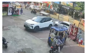
लोकतंत्र की शान, पटना