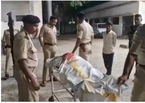
लोकतंत्र की शान, पटना