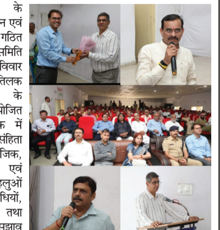
जन प्रतिनिधियों, समाजसेवियों आदि ने भी शामिल होकर अपने महत्वपूर्ण सुझाव दिए।