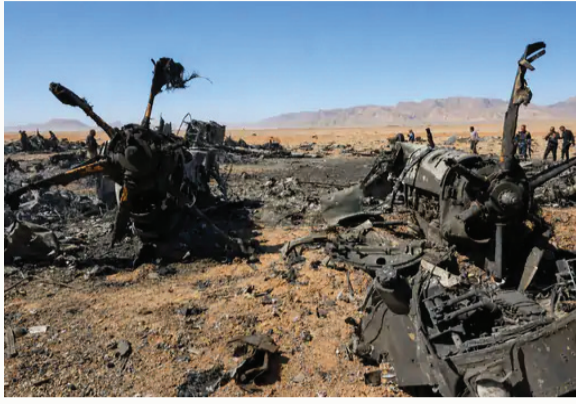
एजेंसी, तेर अवीव/तेहरान/वॉशिंग्टन डीसी

ईरान के सीनियर अधिकारी मोहसिन रजाई ने अमेरिका को चेतावनी देते हुए कहा कि होर्मुज स्ट्रेट को अमेरिकी सेना की कब्रगाह बना दिया जाएगा। मोहसिन रजाई पहले ईरान की रिवोल्यूशनरी गार्ड (IRGC) में कमांडर रह चुके हैं। उन्होंने अमेरिकी सेना को समुद्री लुटेरा (पाइरेट) बताते हुए कहा कि अमेरिका दुनिया का इकलौता ऐसा पाइरेट है जिसके पास एयक्राफ्ट कैरियर हैं। रजाई ने पिछले महीने इस्फ़हान में एक अमेरिकी F-15E विमान गिराए जाने का जिक्र करते हुए कहा कि जैसे उस विमान का मलबा पड़ा था, वैसे ही अमेरिकी जहाजों और सैनिकों का भी अंजाम हो सकता है।