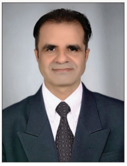
लोकतंत्र की शान