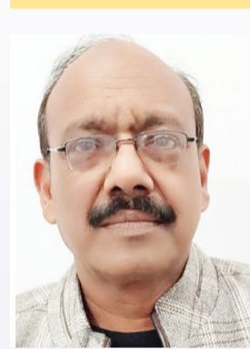
लेखक- मनोज कुमार अग्रवाल

इसे हादसा कहें या बदहाल और गैर जिम्मेदार भ्रष्ट व्यवस्था की हद दर्ज की लापरवाही जिसके चलते करीब पन्द्रह हंसती खेलती जिनकी मौत के आगोश में समा गयीं और दर्जन भर परिवारों को कभी न भूलने वाला दुख दे गयीं। 30 अप्रैल गुल्बर्गा को मध्यप्रदेश के जबलपुर जिले से एक बड़े हादसे की खबर सामने आई है।जबलपुर जिले के बरगी बांध कूज हादसे को तीन दिन से अधिक समय बीत चुका है। लेकिन अब भी कुछ लोग लापता हैं। उनके जिंदा मिलने की उम्मीद कम है, लेकिन अपनों की उम्मीद है कि दूटती हैं। आखें टकटकी लगाए उनका इंतजार देख रही हैं। आपको बता दें जबलपुर मम के खास पर्यटन स्थल बरगी डैम में गुरुवार 30 अप्रैल की शाम पर्यटकों