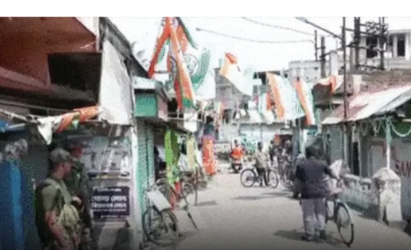
एजेंसी, कोलकाता/नई दिल्ली

पश्चिम बंगाल में सुवेंदु अधिकारी ने रविवार को कहा कि काउंटिंग इयूटी पर तैनात कई अधिकारी अपनी इयूटी, लोकेशन और पद की जानकारी अपने विभागीय संगठनों और एसोसिएशन को शेयर कर रहे हैं। उन्होंने इसे नियमों के खिलाफ बताया। सुवेंदु ने X पर पोस्ट कर वॉट्सएप मैसेज के स्क्रीनशॉट भी शेयर किए। उन्होंने कहा कि एक स्प्रेडशीट और लिस्ट संकुलित हो रही हैं। इसमें अधिकारी अपनी इलेक्शन इयूटी की जानकारी और काउंटिंग में उनकी भूमिका भर रहे हैं।