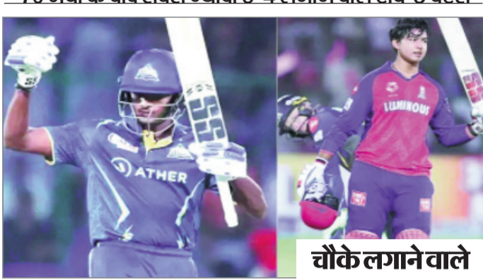
चौके लगाने वाले टॉप-5 बल्लेबाज

70 मैचों के बाद सबसे ज्यादा 6-4 लगाने वाले टॉप-5 बैटर्स