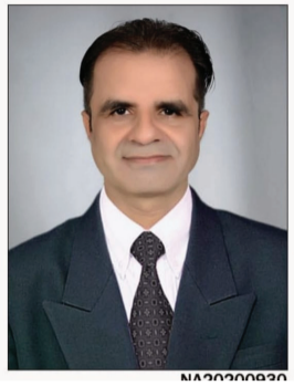
लोकतंत्र की शान