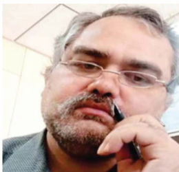
लेखक - संजय गौरवामी

विश्व मधुमक्खी दिवस हर साल 20 मई को मनाया जाता है इस दिन को मनाते का मुख्य उद्देश्य पर्यावरण, खाद्य सुरक्षा और जैव विविधता को बनाए रखने में मधुमक्खियों और अन्य परागणकों के महत्व के बारे में जागरूकता बढ़ाना है। मधुमक्खी एक सामाजिक कीट का सबसे अच्छा उदाहरण है जो शहद इकट्ठा करती है और अपने परिवार का भरण-पोषण करती है। यह कीट हार्मोनोटेरा गण के एपिस परिवार के अंतर्गत आता है। भारत में मधुमक्खियों की तीन प्रजातियाँ पाई जाती हैं, भारतीय मधुमक्खी (एपिस इंडिका), रॉक शहद मधुमक्खी (एपिस डोरसोटा) और छोटी शहद मधुमक्खी (एपिस फ्लोरिया)। एक विदेशी शहद मधुमक्खी (एपिस मेलिफेरा) जिसे इटालियन या यूरोपीय शहद मधुमक्खी कहा जाता है, अब भारत में स्थापित हो गई है और इसका उपयोग व्यावसायिक मधुमक्खी पालन के लिए किया जा रहा है। मधुमक्खियों के प्रकार - मधुमक्खियों की उपरोक्त चार प्रजातियों के बारे में संक्षिप्त जानकारी इस प्रकार है - (1) भारतीय शहद मधुमक्खी (एपिस सेराना इंडिका) - यह शहद मधुमक्खी पूरे भारत में पाई जाती है। यह पीले भूरे रंग की होती है। यह पुरानी इमारतों, जंगलों, पेड़ों की खोखली दीवारों, गुफाओं आदि जैसे अंधेरे स्थानों में 6-8 समानांतर छत्ते बनाती है। ये मधुमक्खियाँ स्वभाव में मधुमक्खी पालक इन्हें प्राकृतिक घरों से पकड़ते हैं और मधुमक्खी के बस्सों में पालते हैं। यह एक उद्यमी मधुमक्खी है तथा अच्छी मात्रा में शहद एकत्रित करती है। औसतन प्रति वर्ष एक कॉलोनी से 2-3 किलोग्राम शहद प्राप्त होता है। (2) रॉक मधुमक्खी (एपिस डोरसोटा) - इस मधुमक्खी को भौरा या भौरा भी कहते हैं। यह सम्पूर्ण भारत में पाई जाती है। पहाड़ी क्षेत्रों में यह समुद्र तल से 1000 मीटर