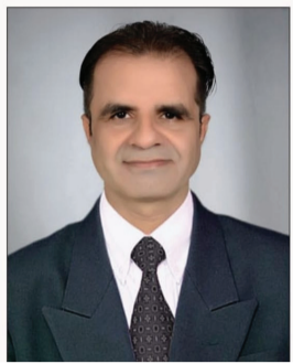
लोकतंत्र की शान