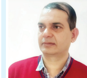
लेखक- सुनील कुमार मल्हा

प्रतिवर्ष 20 मई को संयुक्त राष्ट्र (यूएन) द्वारा घोषित विश्व मधुमक्खी दिवस (वर्ल्ड बी डे) मनाया जाता है। वास्तव में इस दिवस को मनाने के पीछे का मुख्य उद्देश्य मधुमक्खियों और अन्य परागणकर्ताओं के महत्व के प्रति आम लोगों को जागरूक करना तथा उनके संरक्षण की दिशा में वैश्विक प्रयासों को प्रोत्साहित करना है। हमें यह बात अपने जेहन में रखनी चाहिए कि मधुमक्खियाँ केवल और केवल शहद बनाने वाली छोटी सी जीव मात्र ही नहीं हैं, बल्कि वे इस पृथ्वी पर जीवन, खाद्य सुरक्षा, जैव-विविधता और पारिस्थितिक संतुलन की अत्यंत महत्वपूर्ण व अहम कड़ी हैं। कहना गलत नहीं होगा कि यदि मधुमक्खियों का अस्तित्व संकट में पड़ता है, तो