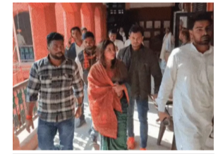
इंस्टा पर लिखा-औरतों को कमजोर केवल राक्षसों ने बोला है, देवताओं ने शक्ति कहा है