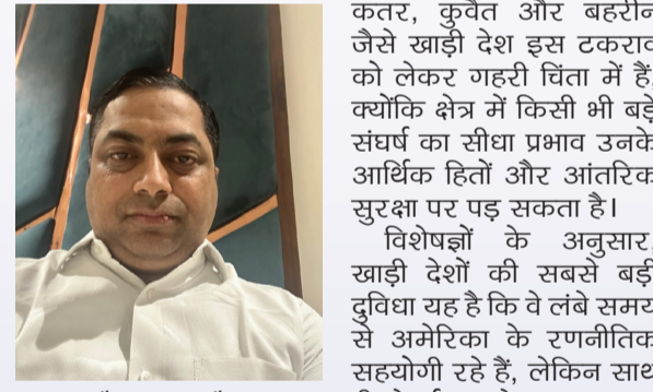
सैयद इसारा हुसैन

मध्य पूर्व एक बार फिर वैश्विक भू-राजनीति का केंद्र बनता जा रहा है। ईरान और अमेरिका के बीच लगातार बढ़ता तनाव अब केवल दो देशों का विवाद नहीं रह गया, बल्कि इसका असर पूरे खाड़ी क्षेत्र की राजनीति, सुरक्षा और अर्थव्यवस्था पर साफ दिखाई देने लगा है। सऊदी अरब, संयुक्त अरब अमीरात (यूएई), कतर, कुवैत और बहरीन जैसे जलमार्ग को बंद करने या यहां अपनी सैन्य मौजूदगी बढ़ाने की चेतावनी दे चुका है। ऐसे में अमेरिका और ईरान के बीच बढ़ती सैन्य गतिविधियों ने पूरे क्षेत्र की बेचैनी बढ़ा दी है। विशेषज्ञ मानते हैं कि यदि हालात युद्ध की ओर बढ़ते हैं, तो सबसे पहले वैश्विक तेल बाजार प्रभावित होगा। कच्चे तेल की कीमतों में भारी उछाल आ सकता है, जिसका असर दुनिया की बड़ी अर्थव्यवस्थाओं पर पड़ेगा। भारत, चीन, जापान और दक्षिण कोरिया जैसे ऊर्जा आयात पर निर्भर देशों की चिंता भी इसी वजह से बढ़ रही है। अमेरिका की रणनीति और खाड़ी देशों की