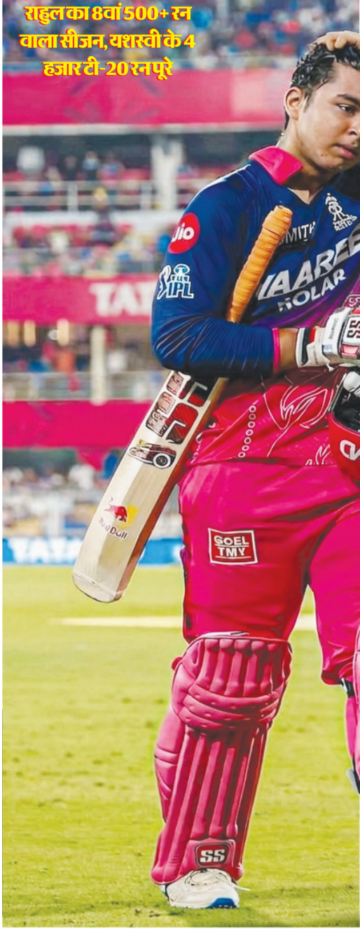
राहुल का 8वां 500+ रन वाला सीजन यशस्वी के 4 हज़ार टी-20 रन पूरे

जीत के बाद भावुक हुए आरोन राय - खिताब जीतने के बाद आरोन राय ने कहा, यह सब किसी सपने जैसा लग रहा है। यह सीजन मेरे लिए काफी निराशाजनक रहा था, इसलिए यहां खड़े होकर ट्रॉफी जीतना मेरी कल्पना से भी बाहर है। उन्होंने गोल्फ को जिंदगी सिखाने वाला खेल बताते हुए कहा, गोल्फ आपको विनम्रता, अनुशासन और कड़ी मेहनत सिखाता है। इस खेल में कुछ भी आसानी से नहीं मिलता। दूसरे खिलाड़ियों का प्रदर्शन - आरोन राय ने 9-अंडर पार के स्कोर के साथ टूर्नामेंट खत्म किया। उनके पीछे एलेक्स स्मैली और जॉन रहम 6-अंडर पार के साथ संयुक्त दूसरे स्थान पर रहे। वहीं मैटी रिमड, लुडविग आर्बर्ग और जस्टिन थॉमस 5-अंडर पार के साथ तीसरे स्थान पर रहे।