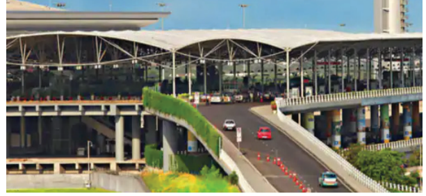
एजेंसी, नई दिल्ली

हैदराबाद एयरपोर्ट पर नीदरलैंड से आ रही कुआलालंपुर एयरवेज की एक फ्लाइट को ईमेल के जरिए बम से उड़ाने की धमकी मिली। धमकी के बाद से पूरा हैदराबाद एयरपोर्ट हाई अलर्ट पर है। मेल में दावा किया गया कि प्लेन में बम है, जो कभी भी फट सकता है। हालांकि फ्लाइट सुरक्षित हैदराबाद पहुंच गई। इससे पहले शुकुवार शाम 6:30 बजे हैदराबाद एयरपोर्ट पर बम की धमकी का एक ईमेल मिला था। जिसके बाद पूरे एयरपोर्ट की जांच हुई थी। इससे पहले 2 एयरपोर्ट कस्टमर सपोर्ट पर दोपहर 2 बजे ईमेल आया। इसके बाद फ्लाइट की सुरक्षित लैंडिंग हुई।