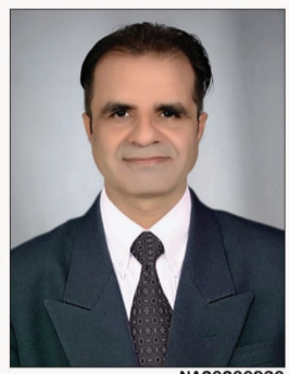
लोकतंत्र की शान