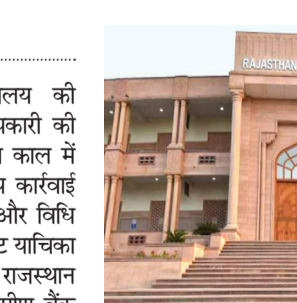
लोकतंत्र की शान