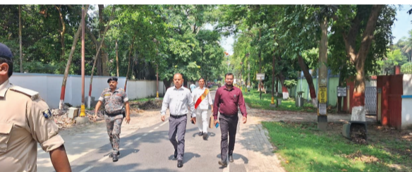
लोकतंत्र की शान