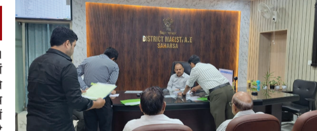
लोकतंत्र की शान