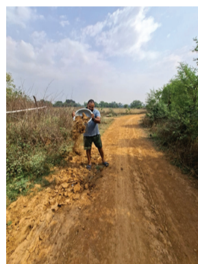
चुहट विधायक के क्षेत्र ग्राम पंचायत ममदर का हाल कांग्रेस के कथित कद्दावर नेता संगठन महामंत्री का गृह ग्राम पंचायत है ममदर भूतपूर्व सैनिक ने जर्जर सड़क का शुरु किया सुधार करना (अव्वा पाण्डेय ब्यूरो प्रमुख) लोकतंत्र की शान

सीधी। ग्राम पंचायत ममदर घोड़ा की सुदूर सड़क लंबे समय से जर्जर अवस्था में पड़ी हुई है। सड़क खराब होने के कारण ग्रामीणों को प्रतिदिन भारी परेशानियों का सामना करना पड़ रहा है। विशेष रूप से बरसात के मौसम में स्थिति और भी गंभीर हो जाती है, जब लोगों का आवागमन, बच्चों का अस्पताल पहुंचाना तथा सर्जनों का स्थूल जाना तक कठिन हो जाता है। ग्रामीणों की ओर से