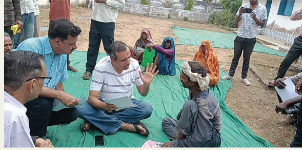
कलेक्टर के प्रति लोगों में दिख रहा भरोसा व विश्वास

लोकतंत्र की शान (ऋचा पाण्डेय की रिपोर्ट)