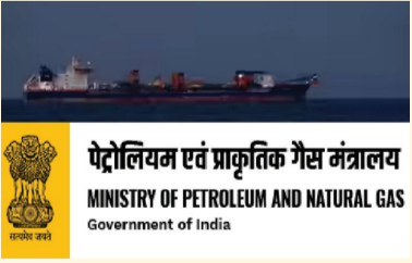
पेट्रोलियम एवं प्राकृतिक गैस मंत्रालय

मंत्रालय ने बताया, "ईरानी कच्चे तेल के एक कार्गो को 'पेंमेंट से जुड़ी दिक्कतों' के कारण भारत के वाडिनार से चीन की ओर मोड़े जाने की खबरें और सोशल मीडिया पोस्ट तथ्यात्मक रूप से गलत हैं।" मंत्रालय ने कहा कि ईरान में