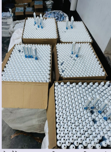
को मौके पर बुलाकर गिरफ्तार कर लिया। जांच में सामने आया कि आरोपित सस्ते और घटिया