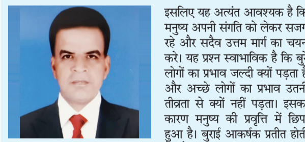
लेखक - कांतिलाल मांडोट

लेखक - कांतिलाल मांडोट मनुष्य का जीवन संगति से निर्मित होता है। जैसा वातावरण मिलता है वैसा ही मनुष्य का स्वभाव बनता जाता है। प्राचीन नीतिकारों ने जल्दी आ सकता है जबकि दुर्जन के चरणों को हटाने के लिए अपने स्वभाव को नहीं छोड़ता। यही कारण है कि सज्जन व्यक्ति को विशेष सावधानी रखनी चाहिए। मनुष्य का सबसे बड़ा शत्रु उसका अतिक्रम है। बाहरी शत्रु उतना नुकसान नहीं पहुँचाता जितना कि गलत निर्णय और गलत संगति पहुँचा देती है। परिवार में भी यदि माता पिता विवेकशील नहीं हैं तो वे अपनी संतान को सही दिशा नहीं दे पाते। आज के समय में यह देखा जा रहा है कि माता पिता अपने बच्चों को आर्थिक रूप से सक्षम बनाने पर तो ध्यान देते हैं लेकिन उनके नैतिक और आध्यात्मिक विकास की ओर उतना ध्यान नहीं देते। परिणामस्वरूप बच्चे भटक जाते हैं और जीवन के सही मार्ग से दूर हो जाते हैं। संस्कारों का निर्माण बचपन से ही होता है। बालक का मन अत्यंत कोमल होता है। वह जैसा देखता है वैसा ही सीखता है। इसलिए यह आवश्यक है कि उसे अच्छा वातावरण दिया जाए। आज के युग में मनोरंजन के साधनों ने बच्चों के मन पर गहरा प्रभाव डाला है। यदि इन साधनों का उपयोग सावधानी से नहीं किया गया तो यह बच्चों को गलत दिशा में ले जा सकता है। इसलिए माता पिता का यह कर्तव्य है कि वे अपने बच्चों के व्यवहार पर ध्यान दें और उन्हें सही मार्ग दिखाएँ। एक प्रेरक प्रसंग इस संदर्भ में अत्यंत महत्वपूर्ण है। एक व्यक्ति जो स्वयं सुन नहीं सकता था वह प्रतिदिन अपने बच्चों को लेकर