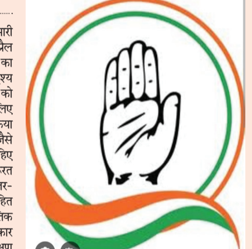
बुलाया जा सकता था। उन्होंने आगे कहा कि परिसीमन के प्रस्ताव पर जल्दबाजी नहीं, बल्कि व्यापक विचार-विमर्श होना चाहिए। उन्होंने याद दिलाया कि 2023 में पास हुए महिला आरक्षण अधिनियम में स्पष्ट रूप से उल्लेख था कि परिसीमन और जनगणना के बाद ही इसे लागू किया जाएगा। कांग्रेस अध्यक्ष ने उस समय भी मांग की थी कि इसे 2024 के आम चुनावों से ही लागू किया जाए, लेकिन सरकार नहीं मानी थी।

नई दिल्ली। कांग्रेस संचार विभाग के प्रभारी महासचिव जयराम रमेश ने मोदी सरकार द्वारा 16 अप्रैल से बुलाए गए संसद के विशेष सत्र को आचार संहिता का खुला उल्लंघन करार देते हुए कहा है कि इसका उद्देश्य तमिलनाडु व पश्चिम बंगाल के विधानसभा चुनावों को प्रभावित करना है। संसदीय सत्र में परिसीमन के लिए भी संविधान संशोधन लाने के समाचारों पर प्रतिक्रिया व्यक्त करते हुए जयराम रमेश ने कहा कि परिसीमन जैसे संवैधानिक मुद्दे पर जल्दबाजी नहीं की जानी चाहिए और इस प्रस्ताव पर व्यापक विचार-विमर्श की जरूरत है। उन्होंने कहा कि जल्दबाजी से दक्षिण भारत, उत्तर-पश्चिमी भारत और उत्तर-पूर्वी भारत के राज्यों सहित कई राज्यों को नुकसान होगा और उनका राजनीतिक प्रतिनिधित्व कम हो जाएगा। कांग्रेस कार्यालय में पुत्रकार वार्ता करते हुए जयराम रमेश ने कहा कि महिला आरक्षण कानून में संशोधन का एकमात्र उद्देश्य विधानसभा चुनावों में लाभ लेना और प्रधानमंत्री द्वारा दोबारा इसका विचार नहीं होना चाहिए। सरकार की मंशा पर बवाल उठाते हुए जयराम रमेश ने कहा कि कांग्रेस का मानना है कि महिला आरक्षण 2024 के आम चुनाव से ही लागू होना चाहिए था। अगर सरकार का 2029 के चुनाव से इसे लागू होने का इरादा है तो कांग्रेस इसका समर्थन करती है। चुनाव को देखते हुए यह संसद सत्र 29 अप्रैल के बाद