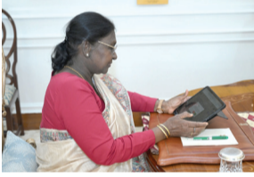
प्रदर्शन करते हुए तीन स्वर्ण पदक जीते और देशभर के युवाओं को प्रेरित किया। उन्होंने कहा कि ऐसी उपलब्धियां यह साबित करती हैं कि जनजातीय क्षेत्रों में प्रतिभा की कोई कमी नहीं है, जरूरत है तो उसे पहचानने और सही दिशा देने की। राष्ट्रपति ने ऐतिहासिक संदर्भों का उल्लेख करते हुए कहा कि जनजातीय समाज में तीरंदाजी जैसी खेल विधाओं की परंपरा अत्यंत प्राचीन और समृद्ध रही है। उन्होंने 'संताह हूल' जैसे ऐतिहासिक आंदोलनों का जिक्र करते हुए बताया कि उस समय भी जनजातीय वीरों के युद्ध कौराव, विशेषकर तीरंदाजी की प्रशंसा की गई थी। साथ ही उन्होंने एकलव्य को प्रेरणा स्रोत बताते हुए कहा कि उनकी महानता आज भी देश के युवाओं को प्रेरित करती है। मुर्मू ने यह भी बताया कि सरकार द्वारा चलाए जा रहे प्रयासों के साथ-साथ व्यक्तिगत और सामुदायिक स्तर पर किए जा रहे छोटे-छोटे प्रयास भी जनजातीय प्रतिभाओं को निखारने में महत्वपूर्ण भूमिका निभा सकते हैं। उन्होंने अपने व्यक्तिगत अनुभव साझा