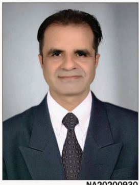
लोकतंत्र की शान

गौदिया - वैश्विक स्तर पर यह स्तब्ध करने वाली घटना है कि 19 अप्रैल 2026 को एक बार फिर अमेरिका में दर्दनाक हत्याकांड हुआ है जिसमें 8 बच्चों की गोली मारकर हत्या कर दी गई है जो मास शूटिंग की बड़ी घटना है।अमेरिका में गन वायलेंस, विशेषकर स्कूलों और बच्चों को निशाना बनाने वाली घटनाएं,आधुनिक विश्व के सबसे खतरनाक और राजनीतिक धुवीकरण सभी की भूमिका जुड़ी हुई है। लगभग एक सदी में विकसित इस समस्या को समझने के लिए इसे कालक्रम, पैटर्न, कारण और प्रभाव के व्यापक संदर्भ में देखना आवश्यक है। अभी 19 अप्रैल 2026 को श्रेवपोर्ट में एक चौकाने वाली और दिल दहला देने वाली घटना हुई है, जहाँ हाल के यू.एस इतिहास की सबसे खतरनाक घटनाओं में से एक में मास शूटिंग में आठ बच्चों की जान चली गई। रिपोर्ट्स के मुताबिक, यह हमला घरेलू हिंसा से जुड़ा था।सिंह बंदूकधारी, जिसकी पहचान परिवार के सदस्य के तौर पर हुई है, ने कथित तौर पर अपने ही सात बच्चों और एक और बच्चे को मार डाला। पीड़ित सभी नाबालिग थे,