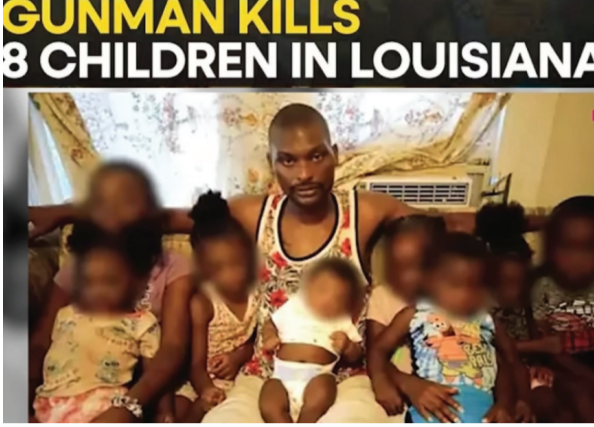
GUNMAN KILLS 8 CHILDREN IN LOUISIANA

सामान्यतः घर को सबसे सुरक्षित स्थान माना जाता है, लेकिन अमेरिका में कई मामलों में घर ही सबसे खतरनाक जगह बनता जा रहा है,खासकर जब वहां हथियारों की आसान उपलब्धता हो। घरेलू हिंसा और बंदूक का संयोजन एक घातक मिश्रण बन जाता है। इस घटना ने यह उजागर किया है कि पारिवारिक विवाद, मानसिक तनाव और गन एक्सेस का मेल कितनी बड़ी त्रासदी को जन्म दे सकता है। साथियों बात अगर हम अमेरिका में गन वायलेंस विशेषकर स्कूल शूटिंग को समझे तो इसके बाद अलग स्वाभाविक प्रश्न यह उठता है कि आखिर यह समस्या इतनी अधिक अमेरिका में ही क्यों केंद्रित है, और भारत जैसे विशाल व विविधतापूर्ण देश में यह क्यों लगभग न के बराबर दिखाई देती है।इस प्रश्न का उत्तर केवल कानून सख्त है या ढीले हैं जैसे सरल निष्कर्षों में नहीं छिपा है, बल्कि यह इतिहास,संस्कृति, सामाजिक संरचनासंस्कृति आर्थिक असमानता,मानसिक स्वास्थ्य और राजनीतिक विमर्श के जटिल अंतरसंबंधों में निहित है। इस संदर्भ में यदि अमेरिका और भारत की तुलना अंतरराष्ट्रीय स्तर के विश्लेषण के रूप में की जाए, तो यह स्पष्ट हो जाता है कि दोनों देशों के बीच अंतर केवल नीतिगत नहीं बल्कि मानसिकता और संस्थागत ढांचे का भी है। साथियों बात अगर हम सबसे पहले अमेरिका की ऐतिहासिक पृष्ठभूमि को समझने की करें तो अमेरिका का