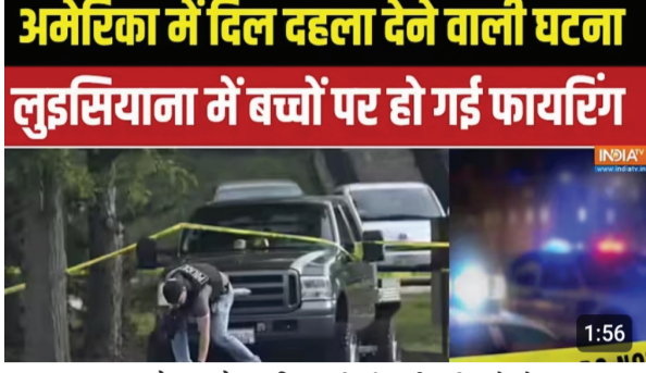
अमेरिका में दिल दहला देने वाली घटना लुइसियाना में बच्चों पर हो गई फायरिंग