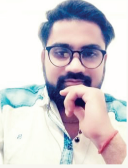
लेखक- दिलीप कुमार पाठक