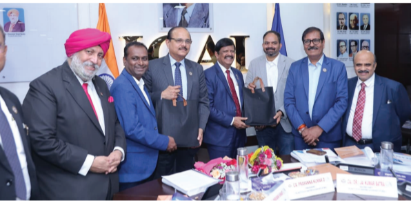
लोकतंत्र की शान

नई दिल्ली: भारत - इंस्टीट्यूट ऑफ चार्टर्ड अकाउंटेंट्स ऑफ इंडिया (ICAI) ने अपने नवगठित बनेफिशियरी स्कीम्स डायरेक्टोरेट (BSD) के माध्यम से भारतकलाउड के साथ एक सहयोग समझौता किया है, जिसके तहत देश भर के चार्टर्ड अकाउंटेंट्स (सीए) को सुरक्षित एवं स्थानीय रूप से होस्ट किए गए क्लाउड समाधान उपलब्ध कराए जाएंगे। इस पहल का उद्देश्य (आईसीएआई) के सदस्यों को डिजिटल अवसरचना को सुदृढ़ करना है, जिससे उन्हें भारतीय नियमों के अनुरूप डेटा स्टोरेज एवं कंप्यूटिंग सेवाओं तक पहुंच मिल सके। इससे डेटा संवर्धन, प्राइवैसी एवं ऑपरेशनल एफिशिएंसी में वृद्धि सुनिश्चित होगी। यह साझेदारी (आईसीएआई) को उस सतत प्रतिबद्धता के अनुरूप है, जिसके तहत वह अपने सदस्यों को आधुनिक तकनीकी उपकरणों से सुसज्जित कर उन्हें तेजी से डिजिटल होने वातावरण में उच्च गुणवत्ता वाली पेशेवर सेवाएं प्रदान करने में सक्षम बना रहा है। इस पार्टनरशिप के अंतर्गत आईसीएआई के सदस्यों को एआई-रेडी क्लाउड