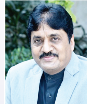
लेखक- तलित गर्ग

हनुमान जयंती केवल एक धार्मिक पर्व नहीं, बल्कि मानव जीवन के चरित्र-निर्माण, आत्मबल, संयम, सेवा और समर्पण की प्रेरणा देने वाला महान दिवस है। यह दिन हमें मंदिरों में दीप जलाने से अधिक अपने भीतर के अंधकार को दूर करने का संदेश देता है। हनुमान केवल शक्ति के प्रतीक नहीं हैं, वे शक्ति के सदुपयोग, ज्ञान की विनम्रता, भक्ति को पराकाष्ठा और सेवा की परंपरा के प्रतीक हैं। इसलिए हनुमान जयंती मनाने का वास्तविक अर्थ है-अपने भीतर के हनुमान को जगाना। हनुमान जी को मंगलकर्ता और विघ्नहर्ता कहा गया है। लेकिन वे विघ्न केवल बाहरी नहीं हटाते, वे मनुष्य के भीतर के विघ्न-अंधकार, भय, आलस्य, क्रोध, लोभ, मोह, इन सबका भी नाश करते हैं। आज