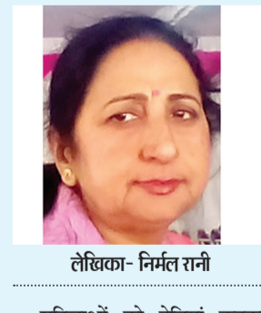
लेखिका- निर्मल रानी

महिलाओं को देवियां कहकर संबोधित करने व देवियों की पूजा करने वाले हमारे देश में आये दिन महिलाओं के यौन शोषण की नई से नई व घिनौनी से घिनौनी खबरें सामने आती रहती हैं। वैसे तो राजनीति, निजी व सरकारी सेवा क्षेत्र, शैक्षणिक संस्थान आदि सभी क्षेत्रों में महिलाओं के यौन शोषण की खबरें सुनाई देती हैं परन्तु बड़े ही दुःख व शर्म की बात यह है कि महिलाओं का सबसे अधिक शोषण उनके अन्धविश्वास के चलते या उनकी धर्मधन्ता के कारण होता है। देश के अनेक बड़े से बड़े स्वयंभू धर्मगुरु जो ईश्वरीय अवतार होने तक का दावा किया करते थे,