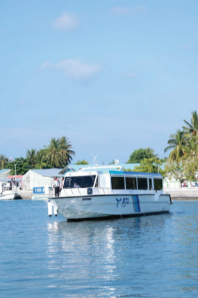
लोकतंत्र की शान