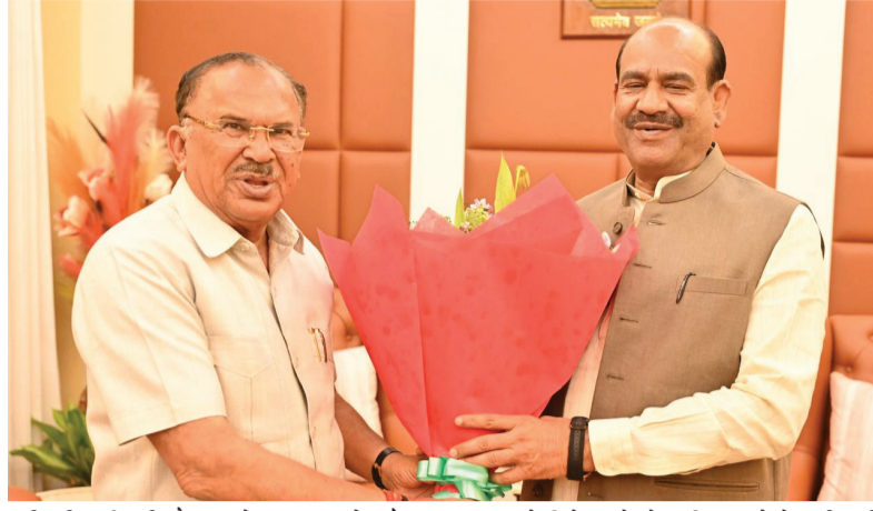
लोकतंत्र की शान