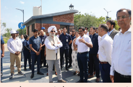
लोकतंत्र की शान

नई दिल्ली। दिल्ली के उपराज्यपाल तरनजीत सिंह संधू ने बुधवार को द्वारका में चल रही दिल्ली विकास प्राधिकरण (डीडीए) परियोजनाओं की समीक्षा की। उन्होंने क्षेत्र के दौर के दौरान द्वारका में आयोजनों, व्यापार और संस्कृति के लिए एक प्रमुख वैश्विक केंद्र के रूप में विकसित होने की अपार क्षमता को रेखांकित किया। यह जानकारी सोशल मीडिया अकाउंट एक्स 'लोक निवास दिल्ली' पर साझा की गई है। उपराज्यपाल ने दौरे के दौरान क्षेत्रों में बारिश के पानी की निकासी, हरित स्थानों के विस्तार, यूईआर-11 के साथ सूचना प्रौद्योगिकी (आईटी) और इंगर्गेशन टेक्नोलॉजी इनोवल्ड सर्विसेज (आईटीईएस) केंद्रों के विकास पर बल दिया। उन्होंने कहा कि यशोभूमि और गोलफ कोर्स जैसी ऐतिहासिक संपत्तियों को विश्व स्तरीय शहरी अवसरचना के आधार के रूप में उजागर किया गया। उपराज्यपाल ने द्वारका की रणनीतिक कनेक्टिविटी और तेजी से विकसित हो रहे पारिस्थितिकी तंत्र पर जोर दिया। उन्होंने दिल्ली में वैश्विक संस्थानों, सम्मेलनों, प्रदर्शनों और उच्चस्तरीय अंतरराष्ट्रीय आयोजनों को आकर्षित करने के लिए एक