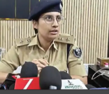
पीड़िता महिला थाना पहुंची, आरोपी पक्ष ने की 10 लाख देकर सेटलमेंट की कोशिश

पटना में नाबालिग के साथ दुष्कर्म का मामला सामने आया है। आरोपी पर 12 वर्षीय बच्ची को बहला-फुसलाकर बंधक बनाकर दो बार रेप करने का आरोप है। पीड़िता मंगलवार को अपने परिजनों के साथ महिला थाना पर शिकायत दर्ज करके पहुंची थी, जहां आरोपी पक्ष के भी लोग पहुंच गए। इस दौरान थाने के बाहर और अंदर समझा बुझाकर मामले को रफा-दफा करने का प्रयास किया गया। समझौता करने 1 से 10 लाख देने का दृष्टि प्रलोभन: आरोपी के बचाव में उसकी मां और बहन भी थाने पर आई थीं। समझौता के लिए 1 लाख से लेकर 10 लाख रुपए तक का प्रलोभन दिया गया। लेकिन पीड़िता अपने स्टेटमेंट पर कायम रही। पीड़िता की ओर से थाने पर लिखित शिकायत की गई। इसके बाद पुलिसकर्मीयों ने जिला सदर अस्पताल गर्दन-बाग में उसका मेडिकल कराया। पीड़िता की ओर से थाने में शिकायत दर्ज कराई