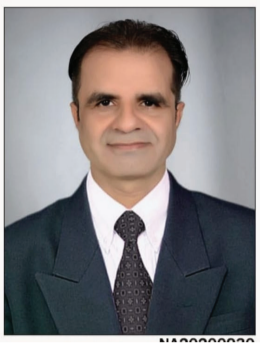
लोकतंत्र की शान