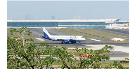
इजराइल के बीच जारी युद्ध के कारण वैश्विक तेल बाजार में आई उथल-पुथल है, जिससे ईंधन की कीमतें तेजी से बढ़ी हैं। आज भी क्रूड ऑयल की कीमतें 100 डॉलर प्रति बैरल से ऊपर हैं। ब्लूमबर्ग के मुबिक ब्रेट क्रूड

नई दिल्ली, एप्रैल 1। ईरान-इजरायल-अमेरिका युद्ध का असर हावाई उड़ानों पर तो दिख ही रहा है अब यात्रियों की जेब पर भी पड़ सकता है। पश्चिम एशिया संकट के बीच भारत में एविएशन टरबाइन फ्यूल की कीमतों में 115 प्रतिशत से ज्यादा की बड़ी बढ़ोतरी कर दी गई है। नई दिल्ली में अब एटीएफ की कीमत 1 अप्रैल यानी आज से बढ़कर लगभग 2.07 लाख रुपये प्रति किलोलीटर हो गई है, जबकि पिछले महीने यह करीब 96,638 रुपये प्रति किलोलीटर थी। इस तेजी का असर आज एविएशन इंडस्ट्री से जुड़ी कंपनियों के शेयरों पर देखने को मिल सकता है। आज इंडिगो, स्पाइसजेट जैसी कंपनियों के शेयरों में बड़ी हलचल रहने के आसार हैं। एटीएफ के रेट्स में इस बढ़ोतरी की बड़ी वजह ईरान-अमेरिका-