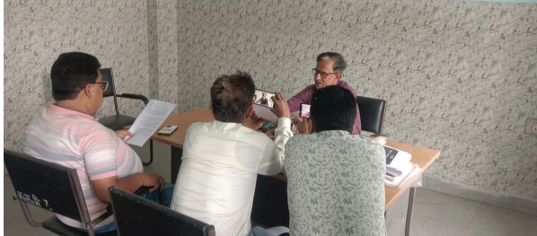
लोकतंत्र की शान

सहरसा | मो. जियाउद्दीन, जिला संवाददाता: सहरसा जिले में आवश्यक वस्तुओं की सुचारू आपूर्ति सुनिश्चित करने और कालाबाजारी पर रोक लगाने के लिए जिला प्रशासन पूरी तरह सतर्क और सक्रिय नजर आ रहा है। जिलाधिकारी के निर्देश पर जिला प्रशासन द्वारा आम जनता को जरूरी सामान समय पर उपलब्ध कराने के साथ-साथ अनियमितताओं पर कड़ी कार्रवाई की जा रही है। जिला आपूर्ति शाखा द्वारा जारी दैनिक स्थिति रिपोर्ट के अनुसार जिले की वर्तमान स्थिति संतोषजनक है। जिला स्तर पर स्थापित नियंत्रण कक्ष (डिस्ट्रिक्ट कंट्रोल रूम) लगातार कारगर है। गुरुवार को विनियंत्रण कक्ष में कुल 13 शिकायतें प्राप्त हुईं, जिनका त्वरित निपटारा कर दिया गया। एलपीजी आपूर्ति और सुरक्षा को लेकर भी प्रशासन ने विशेष सतर्कता बरती है। जिले की 34 गैस एजेंसियों में से 11 संवेदनशील एजेंसियों पर सुरक्षा के ट्रैकिंग पर पुलिस बल की तैनाती की गई है। आंकड़ों के अनुसार, जिले में 3,222 बुकिंग के मुकाम्ले 2,130 सिलेंडरों की होम डिलीवरी सुनिश्चित की गई है। वर्तमान में जिले में 6,078 भरे हुए सिलेंडरों का पर्याप्त स्टॉक उपलब्ध है। कालाबाजारी और जमाखोरी के खिलाफ प्रशासन द्वारा सख्त अभियान चलाया जा रहा है। आवश्यक वस्तु अधिनियम के तहत आज एक स्थान अनियमितताओं पर कड़ी कार्रवाई की जा रही है। जिला आपूर्ति शाखा द्वारा जारी दैनिक स्थिति रिपोर्ट के अनुसार जिले की वर्तमान स्थिति संतोषजनक है। जिला स्तर पर स्थापित नियंत्रण कक्ष (डिस्ट्रिक्ट कंट्रोल रूम) लगातार कारगर है। गुरुवार को विनियंत्रण कक्ष में कुल 13 शिकायतें प्राप्त हुईं, जिनका त्वरित निपटारा कर दिया गया। एलपीजी आपूर्ति और सुरक्षा को लेकर भी प्रशासन ने विशेष सतर्कता बरती है। जिले की 34 गैस