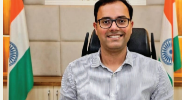
कलेक्टर श्री तिवारी ने बाल विवाह को रोकथाम के लिए समाज से भी आगे आने और जिला प्रशासन के साथ सहयोग करने की अपील की है*। उन्होंने कहा कि बाल विवाह की सूचना पुलिस कंट्रोल रूम सहित संबंधित एसडीएम और महिला एवं बाल विकास विभाग के परियोजना अधिकारियों को भी दी जा सकती है। कलेक्टर ने तार्कीद किया कि प्रशासन बाल विवाह को रोकथाम के लिए सजग और मुसतैद है। बाल विवाह रोकथाम अधिनियम 2006 की धारा 9,10,11 एवं 13 के तहत बालविवाह कराने, सहयोग देने वाले व्यक्ति, व्यक्तियों, संस्था, सामाजिक संगठन के लिए दो वर्ष तक कारावास अथवा एक लाख रुपये का जुर्माना या दोनों का प्रावधान है। जिला कार्यक्रम अधिकारी महिला बाल

कटनी - जिले में अक्षय तृतीया एवं पूर्व अन्य विवाह मुहूर्तों पर बाल विवाह को रोकथाम के लिए एक सशक्त, समन्वित और बहुस्तरीय व्यापक कार्ययोजना बनाई गई है। इसके लिए विकासखंड स्तर पर संबंधित क्षेत्र के एसडीएम की अध्यक्षता में 6 सदस्यीय बाल विवाह रोकथाम दल गठित किया गया है। कलेक्टर श्री आशीष तिवारी ने अधिकारियों को निर्देशित किया है कि बाल विवाह निगरानी समितियां और कोर ग्रुप बाल विवाह संबंधी गतिविधियों पर सख्त नजर रखें। उन्होंने कहा कि बाल विवाह एक गंभीर सामाजिक बुराई है। समाज में इस कुप्रथा का स्वरूप बहुत ही भयावह है। कलेक्टर श्री तिवारी ने बाल विवाह को रोकथाम के लिए समाज से भी आगे आने और जिला प्रशासन के साथ सहयोग करने की अपील की है*। उन्होंने कहा कि बाल विवाह की सूचना पुलिस कंट्रोल रूम सहित संबंधित एसडीएम और महिला एवं बाल विकास विभाग के परियोजना अधिकारियों को भी दी जा सकती है। कलेक्टर ने तार्कीद किया कि प्रशासन बाल विवाह को रोकथाम के लिए सजग और मुसतैद है। बाल विवाह रोकथाम अधिनियम 2006 की धारा 9,10,11 एवं 13 के तहत बालविवाह कराने, सहयोग देने वाले व्यक्ति, व्यक्तियों, संस्था, सामाजिक संगठन के लिए दो वर्ष तक कारावास अथवा एक लाख रुपये का जुर्माना या दोनों का प्रावधान है। जिला कार्यक्रम अधिकारी महिला बाल