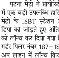
लोकतंत्र की शान, पटना

पटना मेट्रो ने प्रायोरिटी कॉरिडोर में एक बड़ी उपलब्धि हासिल की है। मेट्रो के ISBT स्टेशन और पटना डिपो को जोड़ते हुए अंतिम यू-गर्डर को लॉन्च कर दिया गया है। यह यू-गर्डर पिलर नंबर 187-188 के बीच अप लाइन में लॉन्च किया गया है। अंतिम गर्डर की लॉन्चिंग के साथ ही प्रायोरिटी कॉरिडोर के सिविल वर्क का बड़ा हिस्सा पूरा हो चुका है। इसके साथ ही इस कॉरिडोर के लिए सभी प्रीकास्ट एलिमेंट्स की स्थापना का काम पूरा हो गया है।