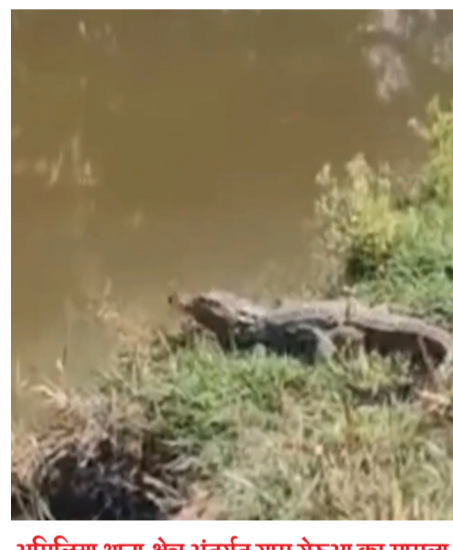
अमिलिया थाना क्षेत्र अंतर्गत ग्राम गेरुआ का मामला