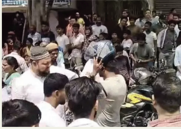
नारेबाजी की। इस प्रदर्शन के कारण सड़क पर वाहनों की लंबी कतारें लड़क गईं और यातायात बाधित हो गया।

गैस लेने के लिए बुलाया, फिर खाली हाथ लौटा दिया-स्थानीय: स्थानीय लोगों ने बताया कि एजेंसी द्वारा बार-बार गैस लेने के लिए बुलाया जाता है, लेकिन पहुंचने पर उपभोक्ताओं को खाली हाथ लौटना पड़ता है। इसी से नाराज होकर रविवार सुबह लोगों ने सड़क जाम कर एजेंसी के खिलाफ