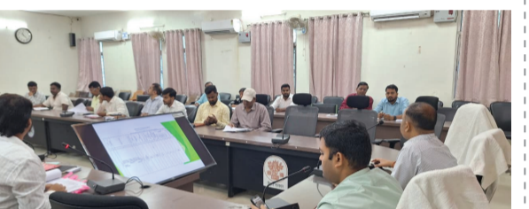
बच्चों के स्क्रीन टाइम को कम करने में अभिभावकों की सक्रिय भूमिका सुनिश्चित करना तथा आंगनवाड़ी केंद्रों को मजबूत बनाने के लिए सामुदायिक सहयोग बढ़ाना शामिल है। जिलाधिकारी ने सभी संबंधित विभागों—आरंसीडीएस, शिक्षा विभाग, स्वास्थ्य विभाग, पंचायती राज विभाग, ग्रामीण विकास विभाग एवं कल्याण विभाग—को निर्देश दिया कि वे अपने-अपने स्तर पर निर्धारित गतिविधियाँ का प्रभावी क्रियान्वयन सुनिश्चित करें। साथ ही पोषण अभियान के डैशबोर्ड पर प्रतिदिन लाखों के अनुरूप आंकड़ों की प्रविष्टि करने का भी निर्देश दिया गया। बैठक में उप विकास आयुक्त, पंचायत राज पदाधिकारी, जिला शिक्षा पदाधिकारी, मुख्य चिकित्सा पदाधिकारी, श्रम अधीक्षक, निदेशक डीआरडीए, जिला कल्याण पदाधिकारी, जिला अल्पसंख्यक पदाधिकारी सहित सभी बाल विकास परियोजना पदाधिकारी एवं अन्य संबंधित अधिकारी उपस्थित थे।

सहरसा | मो. जियाउद्दीन, जिला संवाददाता: जिलाधिकारी की अध्यक्षता में आज राष्ट्रीय पोषण मिशन के अंतर्गत पोषण पखवाड़ा का शुभारंभ किया गया। इस अवसर पर विभिन्न विभागों के अधिकारियों की उपस्थिति में पोषण से जुड़ी गतिविधियों को जन-आंदोलन के रूप में संचालित करने पर बल दिया गया। इस वर्ष पोषण पखवाड़ा के तहत पाँच प्रमुख उद्देश्यों को निर्धारित किया गया है। इनमें माता एवं शिशु के समुचित पोषण पर विशेष ध्यान देते हुए सुलुलित आहार सुनिश्चित करना, 0 से 3 वर्ष तक के बच्चों के मसिक्त विकास के लिए प्रारंभिक प्रोत्साहन देना, 3 से 6 वर्ष के बच्चों के लिए खेल आधारित शिक्षा को बढ़ावा देना,