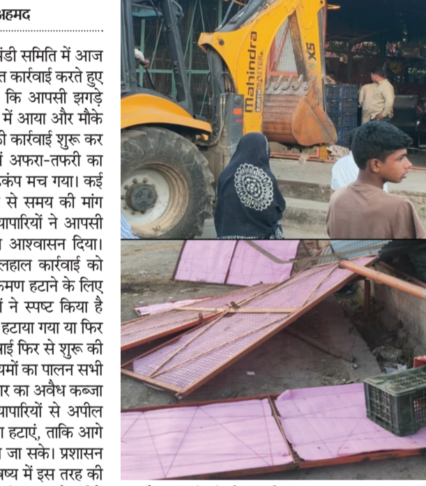
बुलडोजर कार्रवाई की जाएगी।

नजीबाबाद-कोटद्वार रोड स्थित मंडी समिति में आज प्रशासन ने अतिक्रमण के खिलाफ सख्त कार्रवाई करते हुए बुलडोजर चलाया। बताया जा रहा है कि आपसी झगड़े और शिकायत के बाद प्रशासन हरकत में आया और मौके पर पहुंचकर अवैध कब्जों को हटाने की कार्रवाई शुरू कर दी। कार्रवाई के दौरान मंडी परिसर में अफरा-तफरी का माहौल बन गया और व्यापारियों में हड़कंप मच गया। कई दुकानदारों और व्यापारियों ने प्रशासन से समय की मांग की, जिसके बाद मंडी कमिटी और व्यापारियों ने आपसी सहमति से खुद अतिक्रमण हटाने का आश्वासन दिया। स्थिति को देखते हुए प्रशासन ने फिलहाल कार्रवाई को रोक दिया है और व्यापारियों को अतिक्रमण हटाने के लिए कुछ समय दिया गया है। अधिकारियों ने स्पष्ट किया है कि अगर तय समय में अतिक्रमण नहीं हटाया गया या फिर दोबारा शिकायत मिली, तो सख्त कार्रवाई फिर से शुरू की जाएगी। मंडी सचिव ने भी कहा कि नियमों का पालन सभी के लिए अनिवार्य है और किसी भी प्रकार का अवैध कब्जा बंदरस्त नहीं किया जाएगा। उन्होंने व्यापारियों से अपील की कि वे स्वयं आगे आकर अतिक्रमण हटाएं, ताकि आगे किसी प्रकार की कड़ी कार्रवाई से बचा जा सके। प्रशासन ने यह भी चेतावनी दी है कि अगर भविष्य में इस तरह की स्थिति दोबारा बनी, तो बिना किसी पूर्व सूचना के सीधे