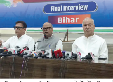
पार्टी तीन प्रमुख क्षेत्रों में प्रतिभाओं की खोज कर रही थी। पहला मीडिया प्रवक्ता-पैनलिस्ट जो टीवी, डिजिटल प्लेटफॉर्म और सार्वजनिक मंचों पर स्पष्टता, विश्वसनीयता और अनुशासन के साथ पार्टी का पक्ष रख सकें।